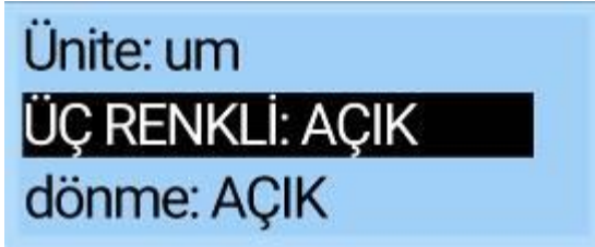
Ana ayar arayüzü

Ayar yöntemi: Ayarlar ana arayüzünde, 'Üç Renkli Ekran'ı seçmek için düğmeye kısa bir süre basın.' Seçim arayüzüne girmek için düğmeyi 3 saniye basılı tutun. Ardından, açmayı veya kapatmayı seçmek için düğmeye kısa bir süre basın. Seçimi onaylamak ve ayarlar ana arayüzüne çıkmak için düğmeyi 3 saniye basılı tutun.