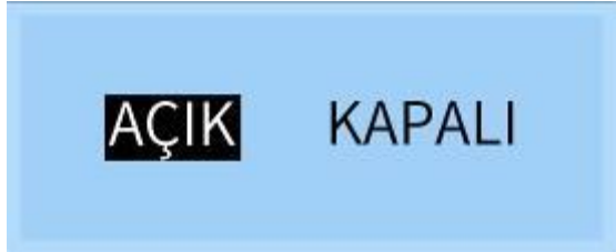
Üç renkli seçim arayüzü