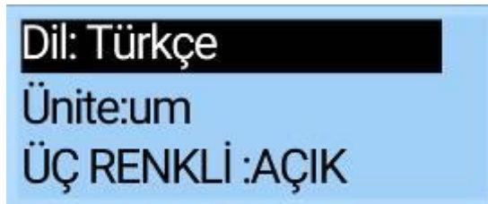
Ana Ayar Arayüzü

Ayarlama yöntemi: Ana ayar arayüzünde, "Dil" seçmek için tuşa kısa basın, dil seçim arayüzüne girmek için tuşa 3 saniye boyunca uzun basın, ardından istenen dili seçmek için tuşa kısa basın, 3 saniye boyunca tuşa uzun basılı tutun, dil seçimini onaylayın ve ana ayar arayüzüne geri çıkın.