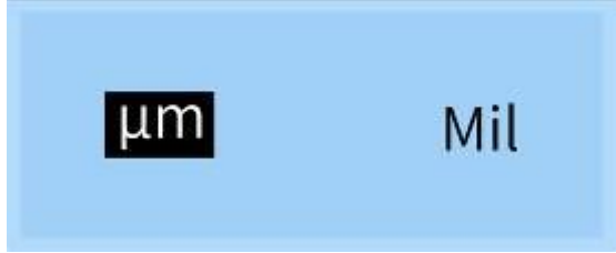
Birim seçimi arayüzü