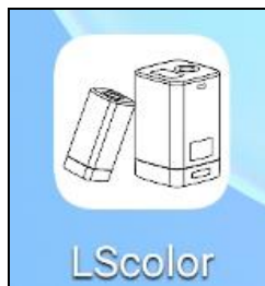
安装完成后 APP 图标