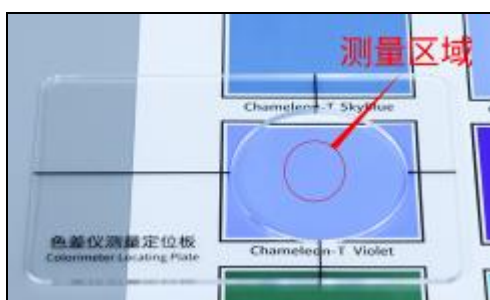
定位孔中心对准测量区域