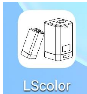
安装完成后 APP 图标