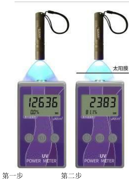
图 1 对太阳膜隔紫外性能的测量