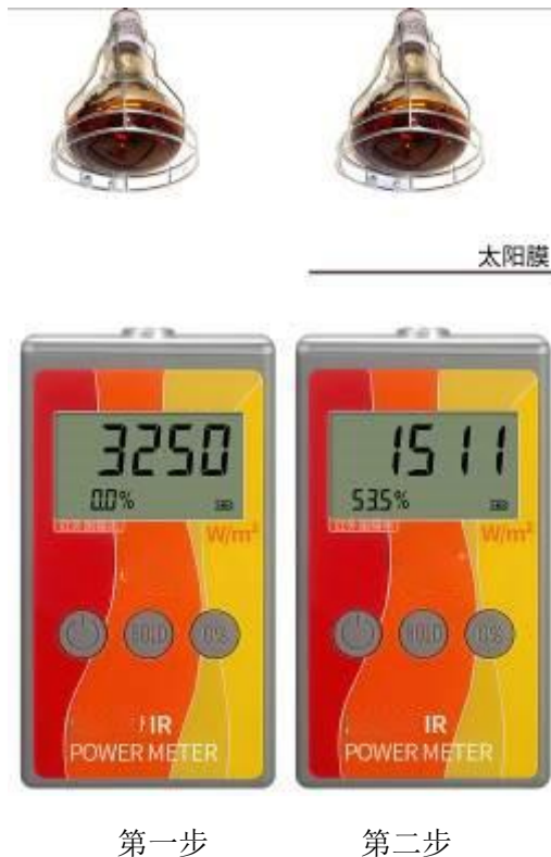
图 1 对太阳膜隔热性能的测量

红外光源可选太阳光或红外灯等。首先测量光源的红外照度 W_{IR1} 。在此情况下，按下“0%”键，设定阻隔率基准值为 0%。